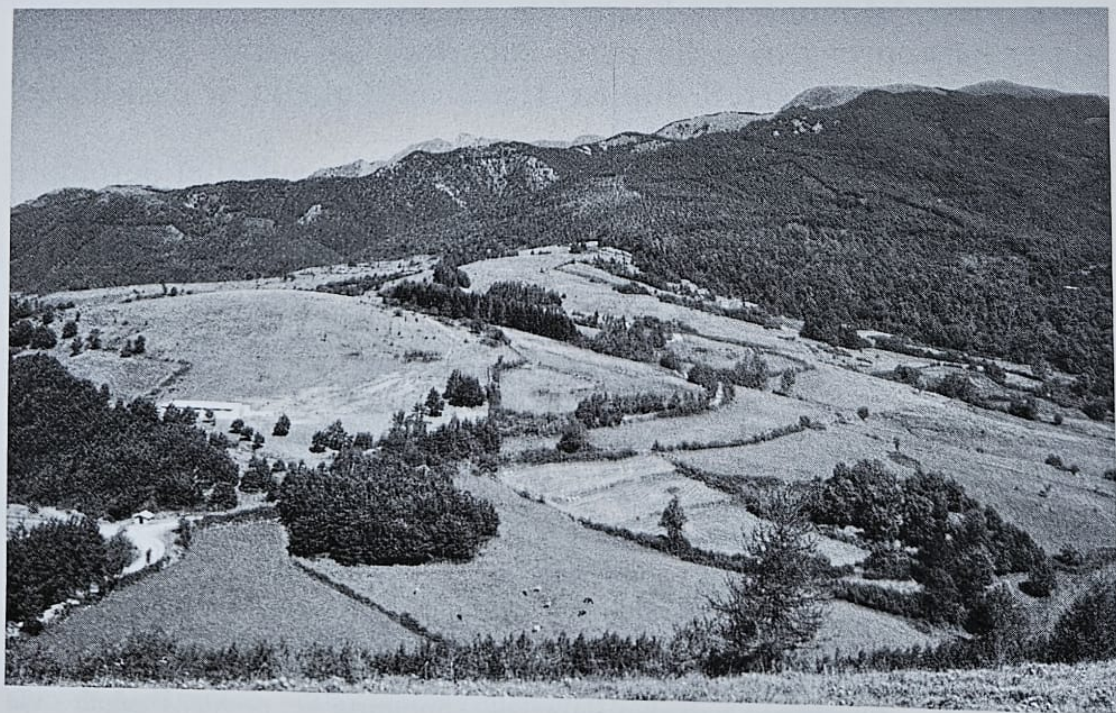
Fig. 2 - La «Contrada Tea» dell'IGM. Il «corso» si trova presso la macchia di abeti al centro della foto. In fondo, a sinistra, la «maestà di Tea». L' Ospitale medioevale si trovava più a sinistra. La cima più a destra è il monte Tondo o Mondulo (m. 1782).